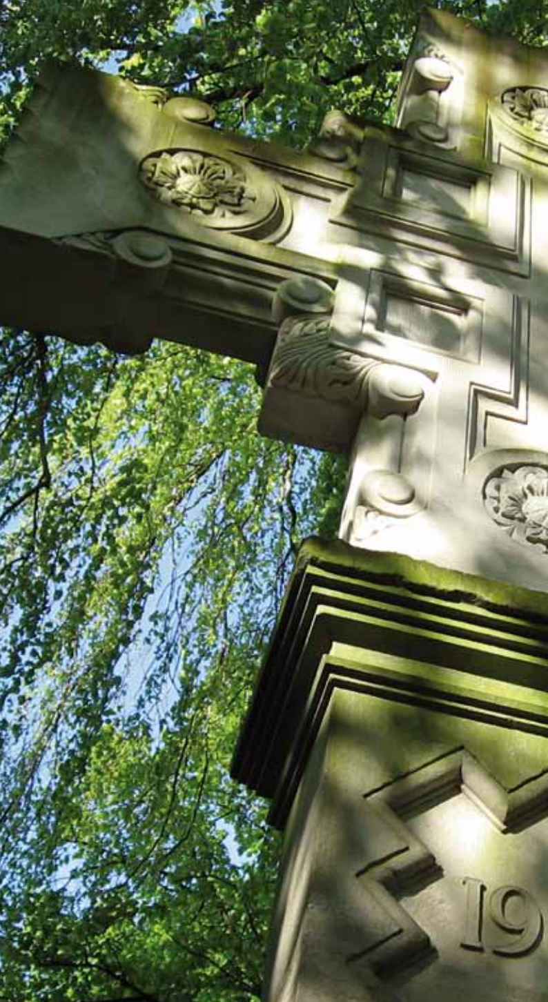
Steinkreuz · Domfriedhof Müllerstraße