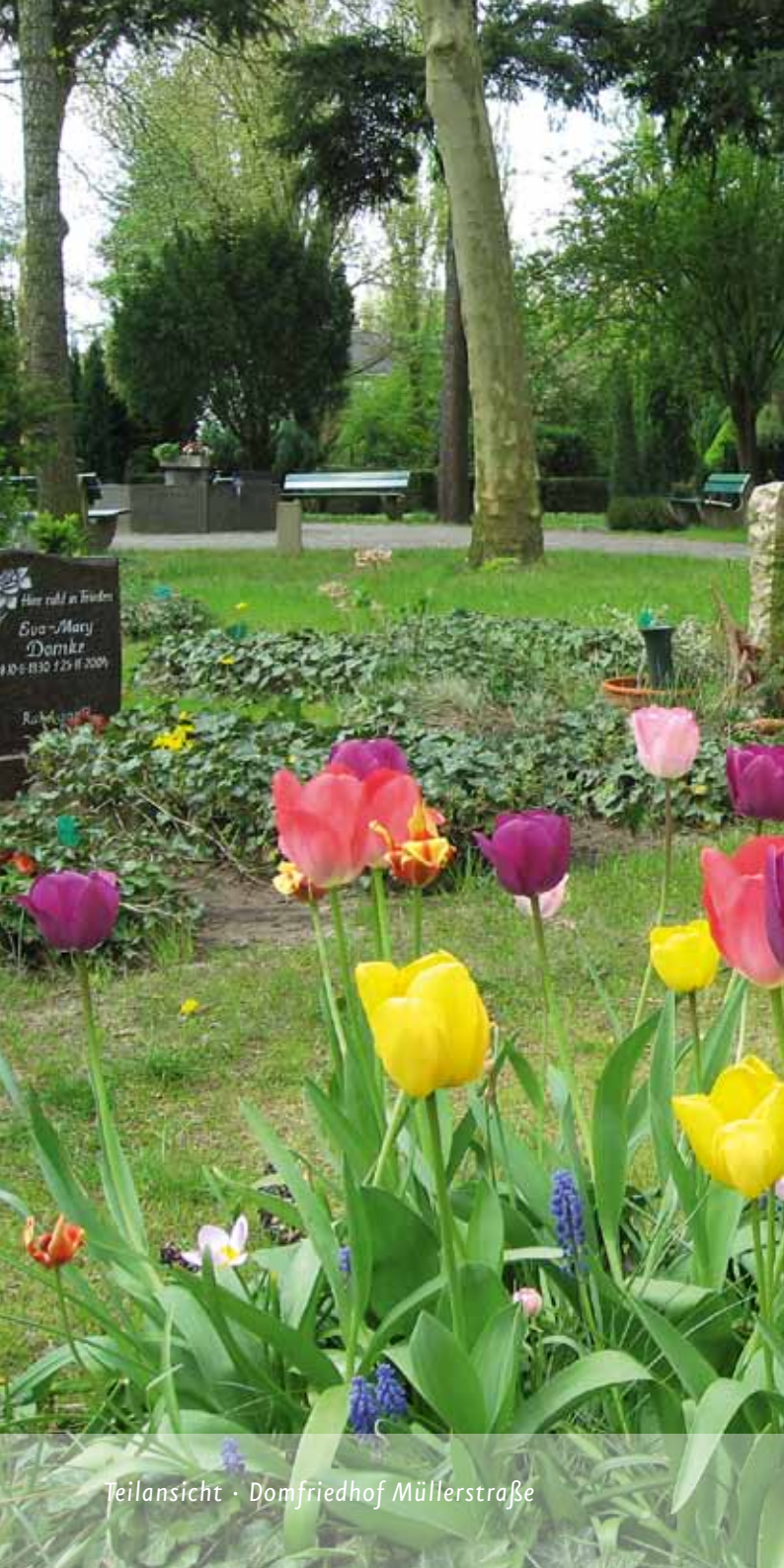
Teilansicht · Domfriedhof Müllerstraße