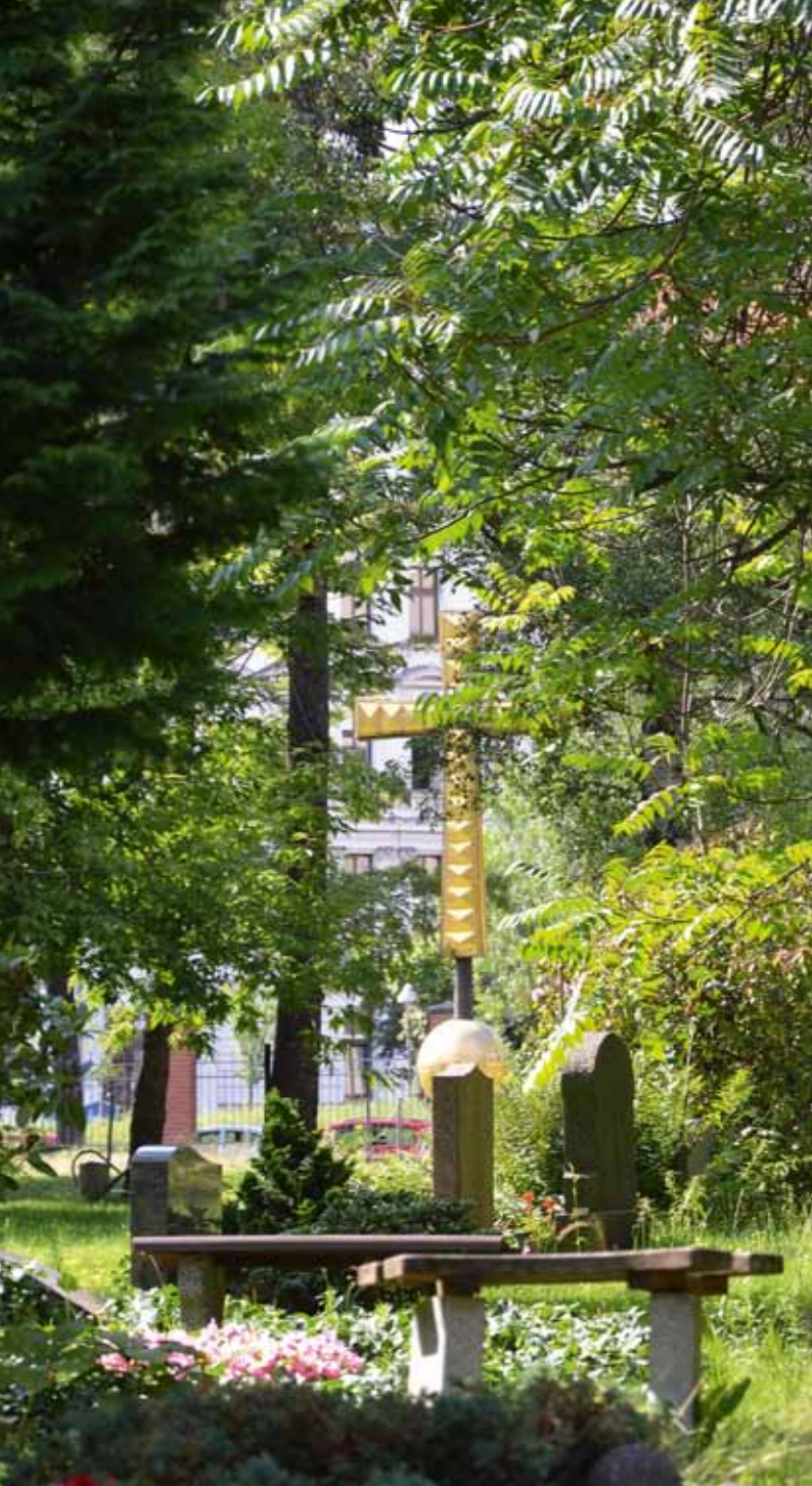
Blick auf das Kuppelkreuz