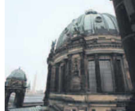
Kuppel-Landschaft. Im Glockenturm kommt der Besucher der Domkuppel ganz nah.