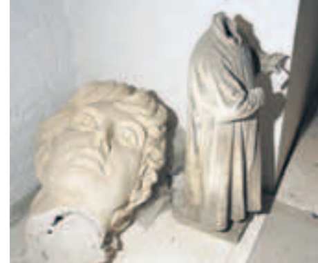
Stückwerk. In den Fluren warten Skulpturteile auf ihre Restaurierung.