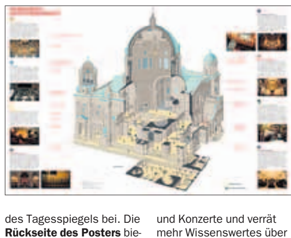
des Tagesspiegels bei. Die Rückseite des Posters bietet Infos über Führungen und Konzerte und verrät mehr Wissenswertes über Berlins zentrale Kirche. lei

Wie viele Kuppelungänge gibt es im Dom und woher kommt man dort hin? Wo innerhalb des Altarraums verbirgt sich der wertvolle Taufstein aus weißem Marmor? Welcher Bereich heißt Predigerkirche? Wo arbeitet die Küsterei und was ist die Beamtenloge? Wo sind die Logen für Minister und Diplomaten? Und wer residiert eigentlich im „Domhotel“? Eine 3-D-Druck mit einem Querschnitt des Doms beantwortet alle diese Fragen. Sie liegt der heutigen Ausgabe