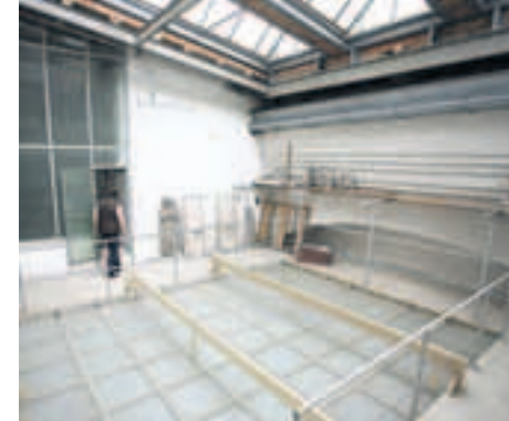
Unterm Dach. Quer durchs Gebäude: ein Blick aufs Tonnengewölbe der Südpempore.